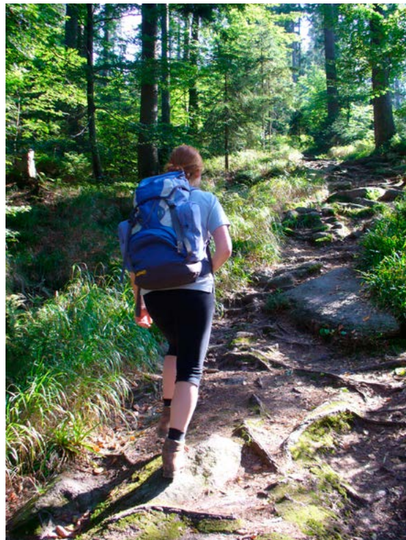
Bewegung in der Natur ist wichtig für das körperliche Wohlbefinden.