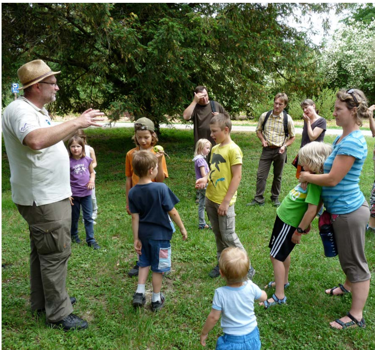
Gemeinsames Naturerleben fördert den sozialen Austausch.

Natur wird auch als Therapie-Ressource eingesetzt, um soziale Fähigkeiten zu stärken. In Wildnistherapien („nature assisted therapies“) erwerben Personen mit unterschiedlichen Verhaltensstörungen soziale Kompetenzen wie Kooperationsbereitschaft und Engagement 39 . Diese Therapieaufenthalte bauen zwar vorrangig auf psychologischen Praktiken auf, eine wesentliche Komponente der Behandlung ist aber immer der intensive Kontakt mit der Natur, der die Therapie unterstützt.