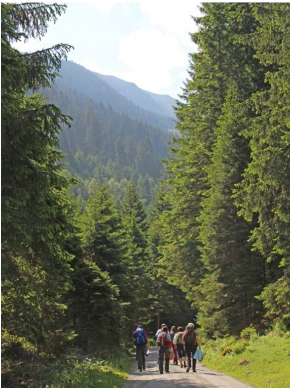
Der Wald – ein Jungbrunnen.

Zahlreiche Studien belegen die gesundheitsfördernde Wirkung von regelmäßiger Bewegung bei verschiedenen