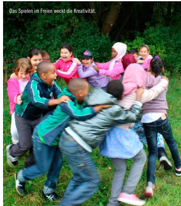
Das Spielen im Freien weckt die Kreativität.

Auch in der Schule ist es wichtig, die Natur einzubeziehen. Maßnahmen zur naturnahen Gestaltung des